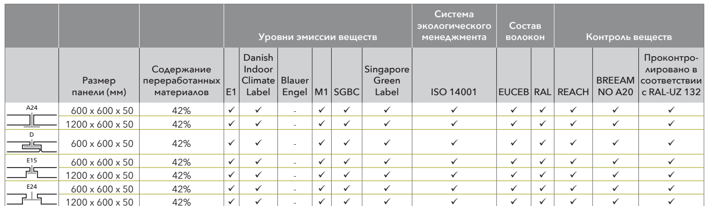
Таблица компонентов, входящих в состав материала

Следующая таблица подразделяет продукцию на категории по типу кромки и содержит всю необходимую информацию по экологическому профилю.