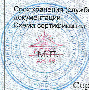
Схема сертификации: 4

Срок хранения (службы, годности) указан в прилагаемой к продукции товаросопроводительной и/или эксплуатационной документации