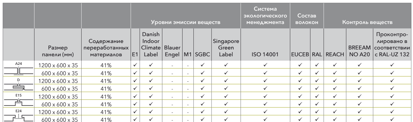
Таблица компонентов, входящих в состав материала

Следующая таблица подразделяет продукцию на категории по типу кромки и содержит всю необходимую информацию по экологическому профилю.